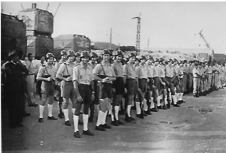
Section CRS sur le port de Fort-de-France en attente de l'arrivée et de l'accostage du paquebot « Antilles »