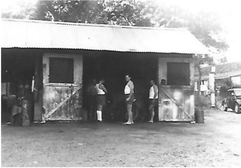
Bâtiment en bois servant d'atelier – Détachement CRS de la Martinique – juillet 1955