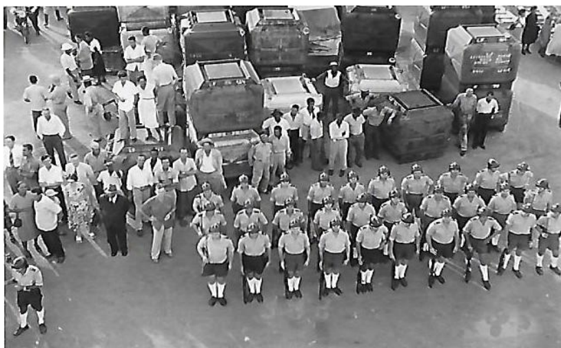
Autre vue de la section CRS sur le port de Fort-de-France en attente de l'arrivée et de l'accostage du paquebot « Antilles »