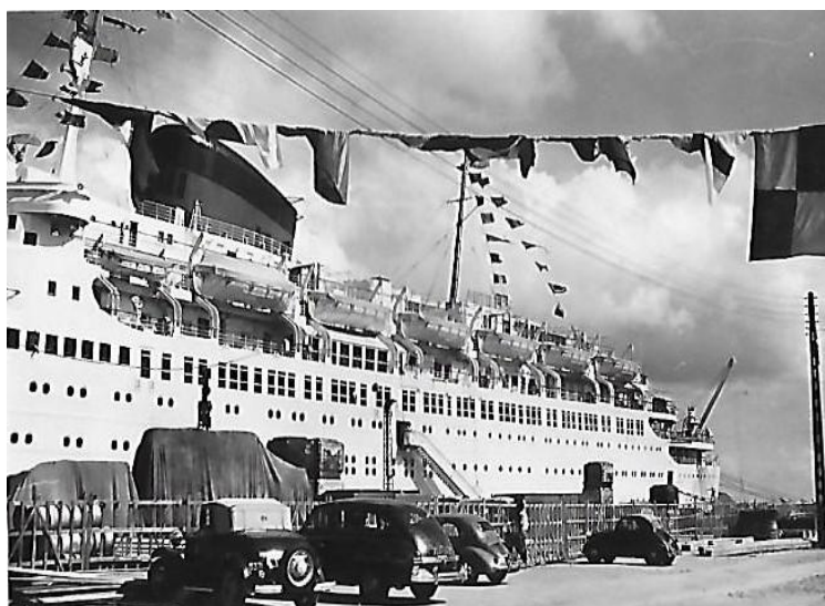
Paquebot « Antilles » à quai à Fort-de-France – juin 1953