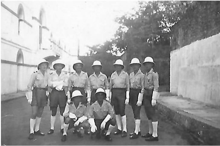
Equipe de circulation dans la cour du cantonnement

Photographies tirées de l'album personnel « Séjour à la Martinique 1952-1956 » réalisé par Paul Bellon Brigadier de police, chef de garage du Détachement CRS de Fort-de-France.