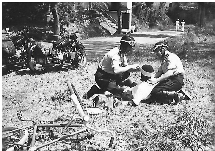
Exercice de secourisme en 1955

Accident de la route - les premiers soins donnés par deux motards CRS