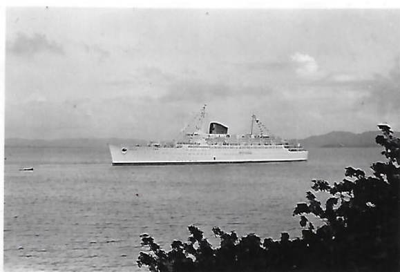
Le paquebot « Antilles » entrant dans la baie de Fort-de-France