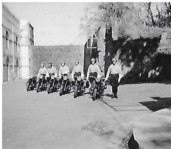
Peloton motocycliste CRS réuni dans la cour du cantonnement du fort Saint-Louis. Préparatif au défilé des motards pour la fête nationale, le 14 juillet 1955

Accident de la route - les premiers soins donnés par deux motards CRS