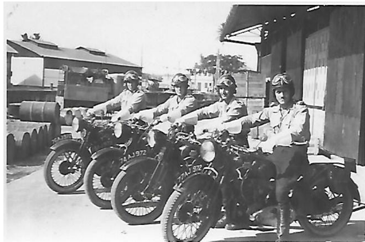
Escorte motocycliste CRS en attente sur le port de Fort-de-France