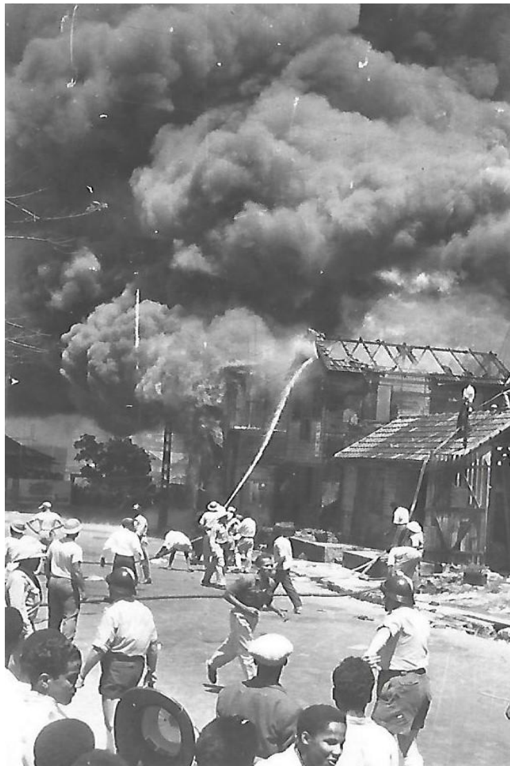
Incendie des entrepôts de la C.G.T à Fort-de-France, le 30 avril 1955. Deux CRS en casque et short assurant la sécurité des personnes

La ligne « antillaise » devient progressivement notamment au lendemain de la seconde Guerre mondiale, très prisée des cargos de la compagnie, qui ramène de grande quantité de rhum, de sucre et de bananes.