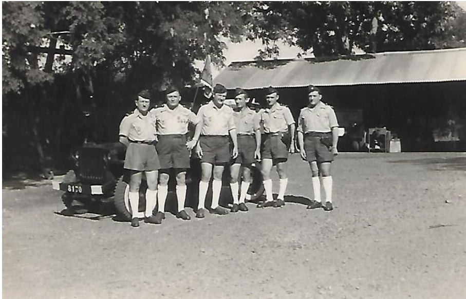
L'équipe des mécaniciens du service du garage - janvier 1955. Le premier à gauche de la photo, mon père