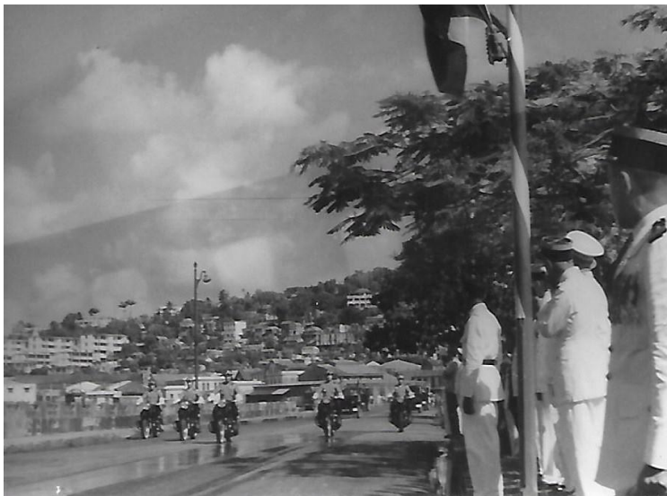
Défilé motorisé du détachement CRS de la Martinique le long du boulevard de la Savane à Fort-de-France - à droite les autorités civiles et militaires de l'île.

Ouverture du défilé CRS par le peloton motocycliste, adoptant la formation en pointe.