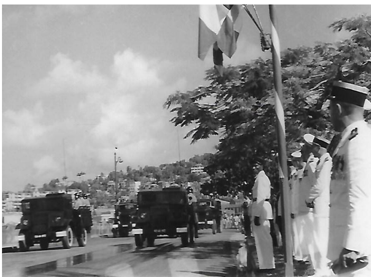
Passage des véhicules Ford Canadian suivis par les GMC 6x6 du détachement CRS.