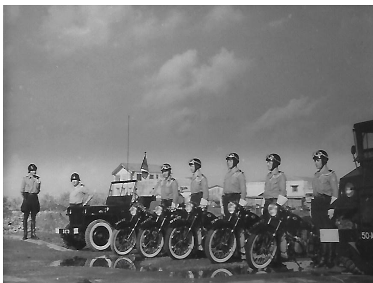
Peloton motocycliste du détachement CRS de la Martinique

Les hommes du détachement CRS sont assis dans les caisses des camions.