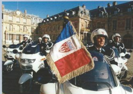
Escorte motorisée pour une cérémonie dans la cour du château de Versailles