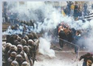
Manifestations de marins pêcheurs à Rennes en 1994

Au final, toute cette expérience acquise associée aux méthodes de commandement ainsi qu'à l'emploi de matériels complexes, ont permis aux compagnies d'atteindre un professionnalisme qui constitue une référence pour de nombreuses polices étrangères.