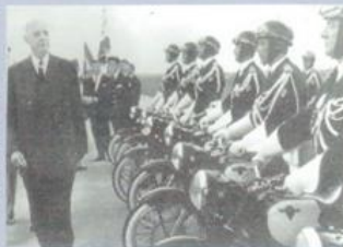
Officialisation de la mission autoroutière

Dans les années cinquante, les CRS voient leurs missions se diversifier au-delà du strict maintien de l'ordre pour assurer la police de la route, le secours en montagne et la surveillance des plages.