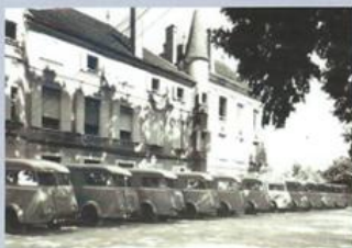
Parc automobile en 1955

C'est dans ce contexte que le gouvernement provisoire crée par décret du 8 décembre 1944 les Compagnies Républicaines de Sécurité.