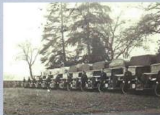
Parc automobile en 1945

En l'absence d'unités militaires encore engagées dans la fin de la guerre et sur les théâtres extérieurs, le Général de Gaulle a besoin d'une force efficace, loyale et disponible en métropole comme en outre-mer.