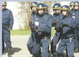
Nouvelles techniques de maintien de l'ordre

Pour atteindre cet objectif, la Direction Centrale des Compagnies Républicaines de Sécurité s'est également dotée d'une nouvelle organisation technique basée sur la complémentarité appui-protection où adaptabilité et mobilité constituent les idées forces.