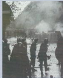
Manifestations à Paris