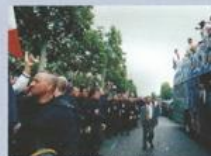
Maintien de l'ordre lors de la coupe du monde de football en 1998

□ Des événements comme la célébration du bicentenaire de la Révolution en 1989, les Jeux Olympiques d'hiver à Albertville en 1992, le cinquantenaire du Débarquement des Alliés en 1994 ou plus récemment, la Coupe du Monde de Football en 1998, nécessitent le déploiement de 30 à 40 unités par jour pour garantir le bon déroulement de ces rendez-vous planétaires.