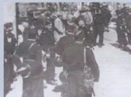
Présence en force dissuasive dans les rues

Prises dans la tourmente du conflit algérien, les CRS, d'une loyauté indéfectible envers les institutions, payent un lourd tribut sur le terrain. Leurs actions et leurs présences empreintes de sang-froid et d'un grand souci de la légalité républicaine renforcent leur image aux yeux de l'Etat et de la communauté internationale.